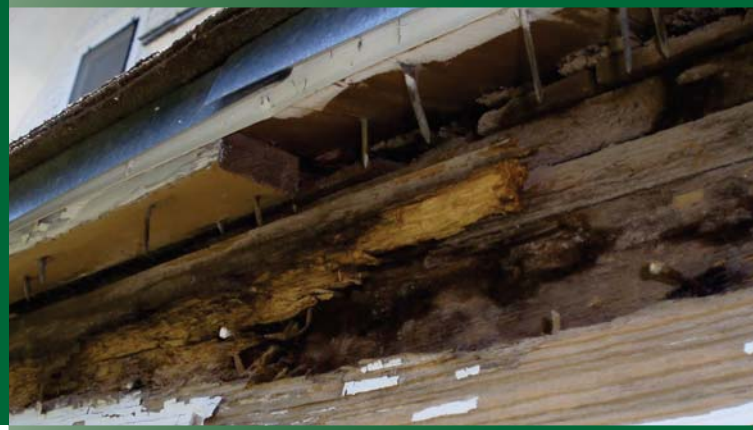
DINDING KAYU DIMAKAN RAYAP DAN BERJAMUR

Isi per dus : 10 lembar Warna Tersedia : Light Grey & Dark Grey